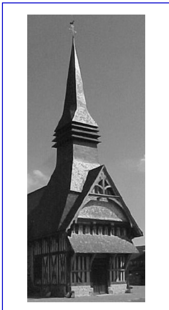
Église de Bonneval